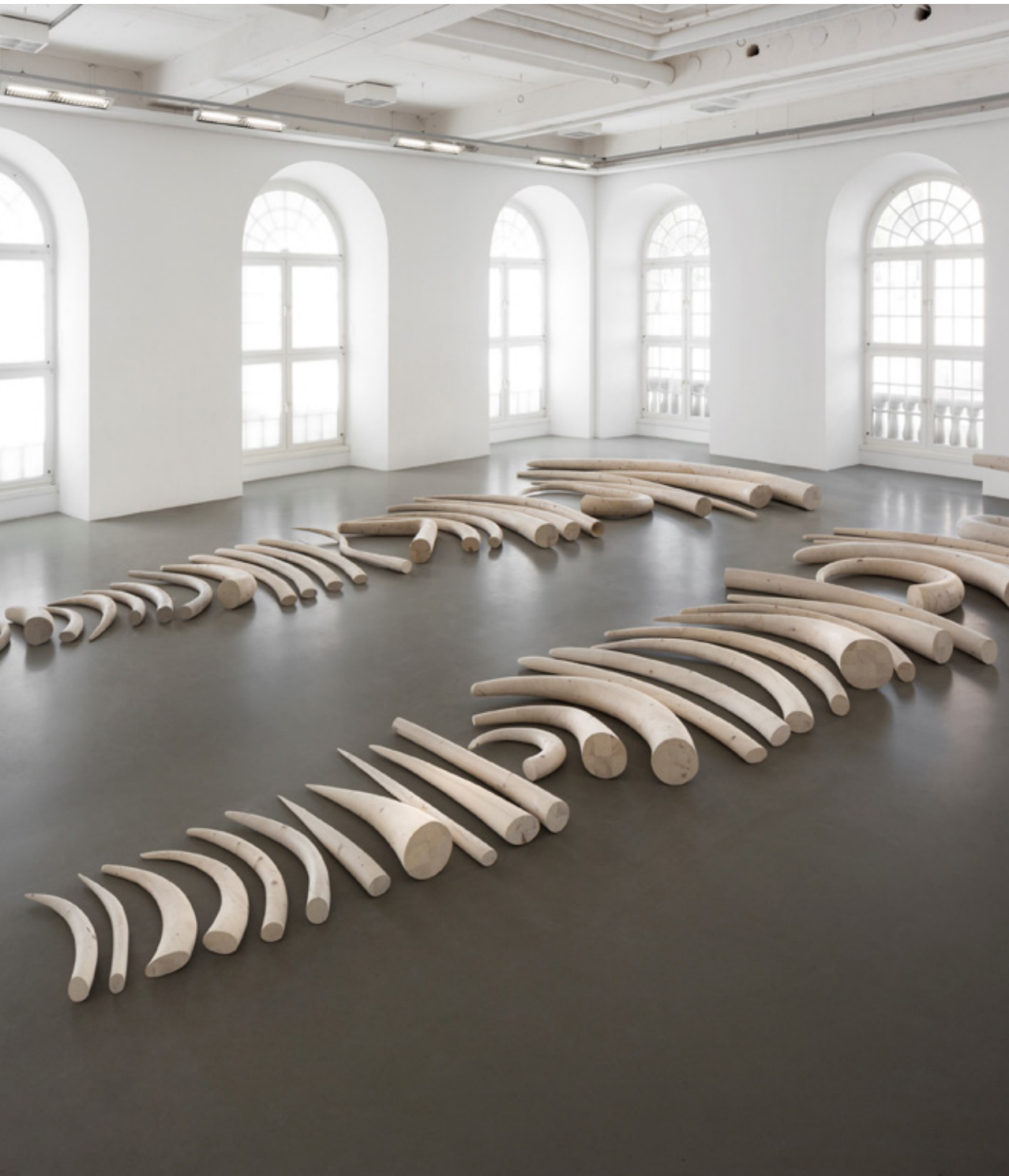
Stoßzähne (Tusks), 2016