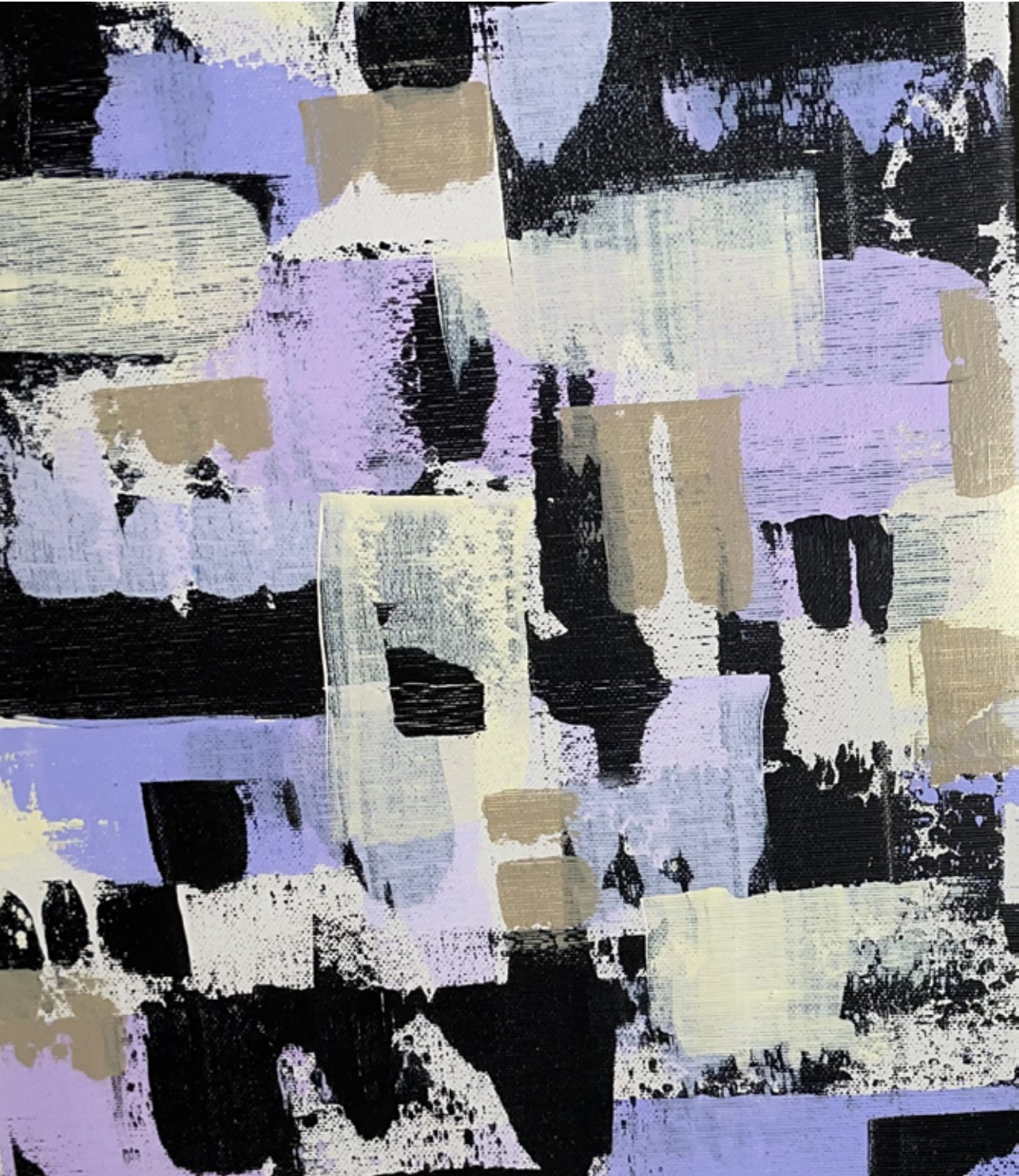
Hafís María Skúladóttir, VMA forsíðumynd / VMA cover photo , 2023