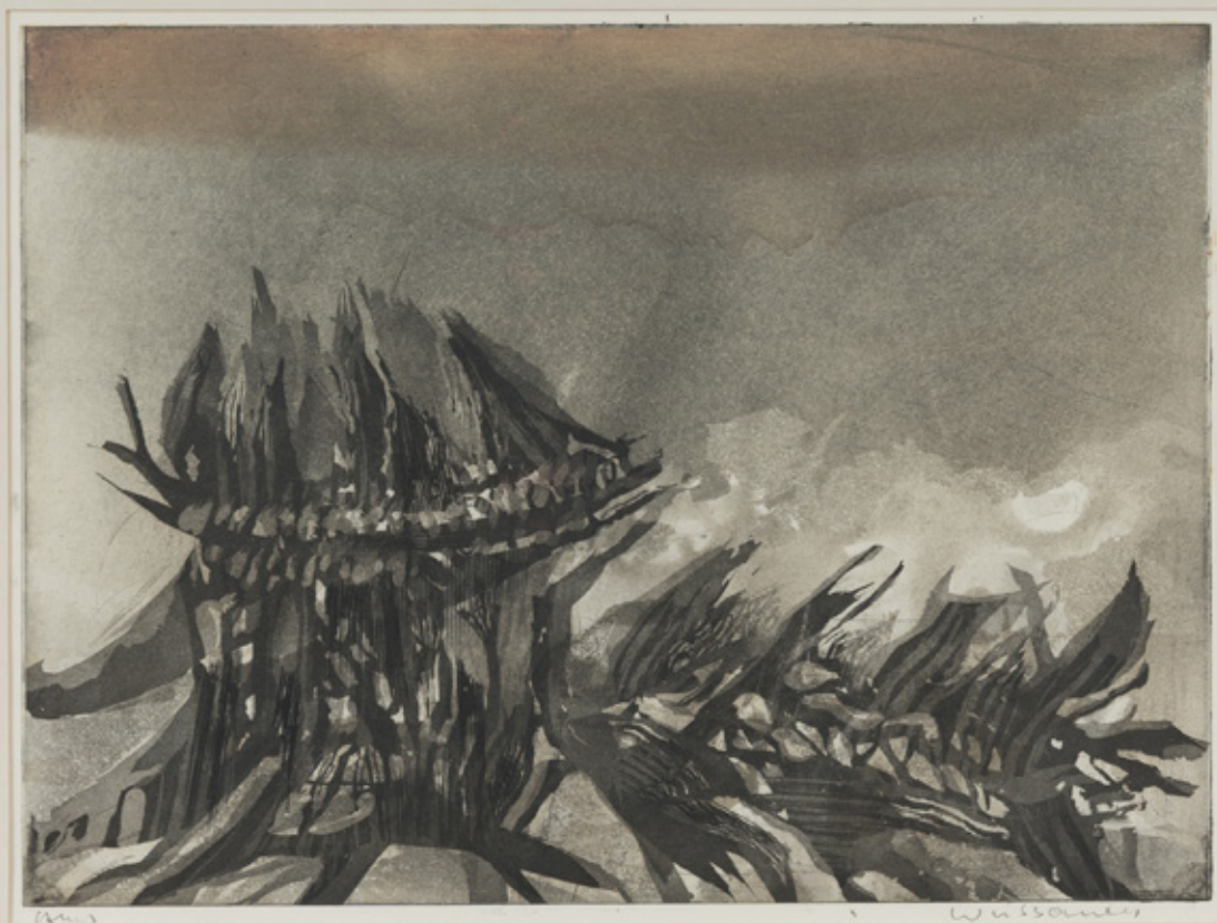
Rudolf Wessaur, Landschaft in Island , án ártals / undated