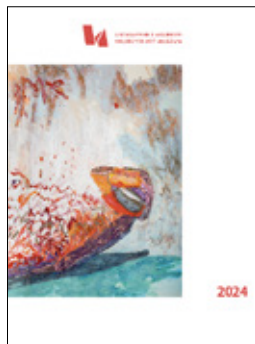
Guðný Kristmannsdóttir Play Me 2023 (hluti úr verki / detail)