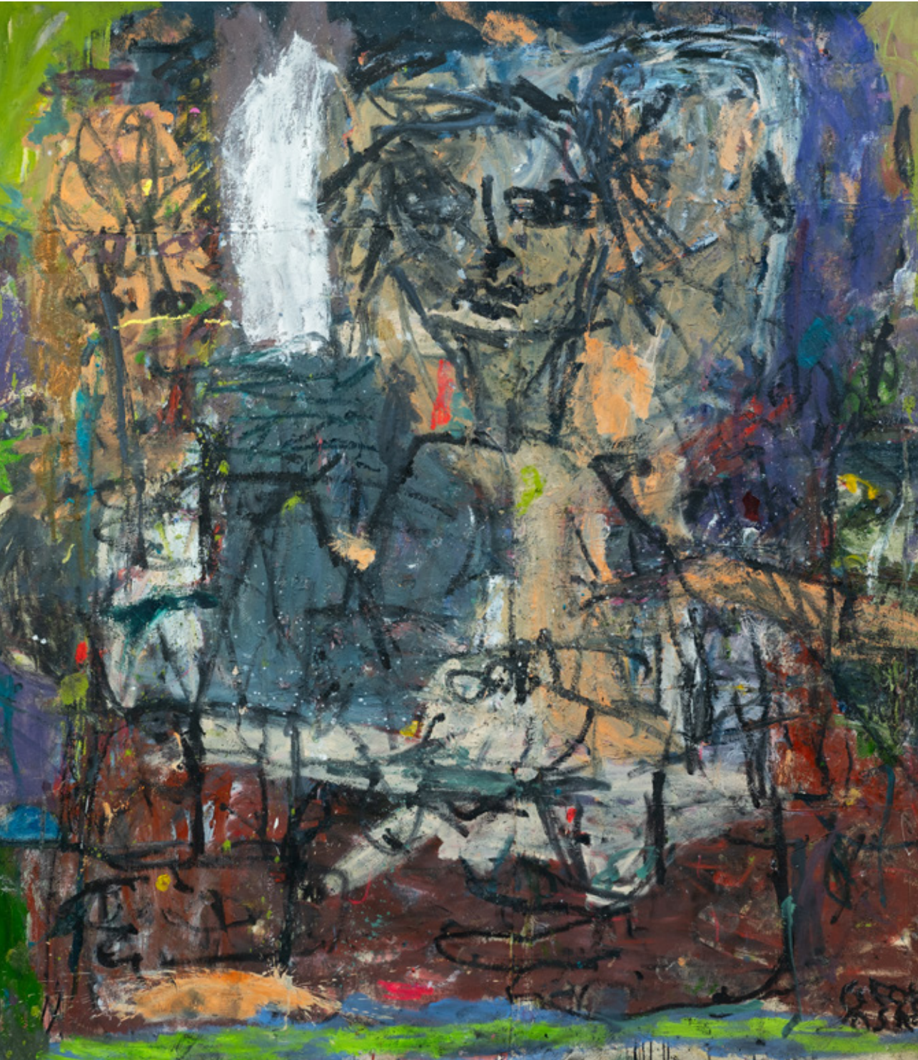
Það er allt í lagi að hafa gaman á meðan það fer ekki út í sprell, 2023