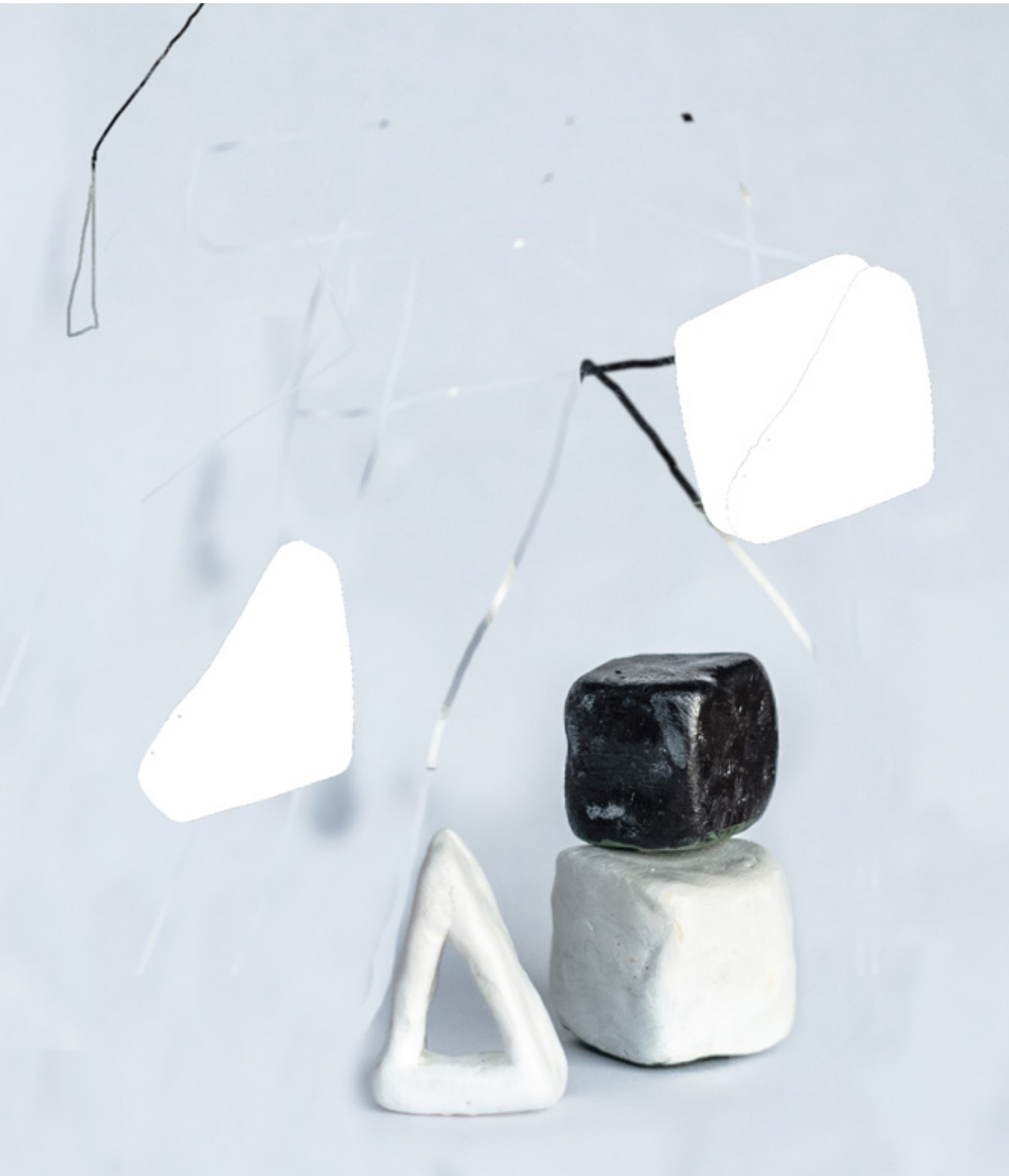
Engill og fluga, 2023 (hluti úr verki / detail)