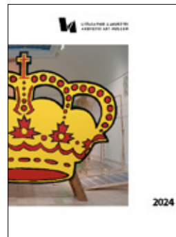
Oliver van den Berg Krone / Crown 2004