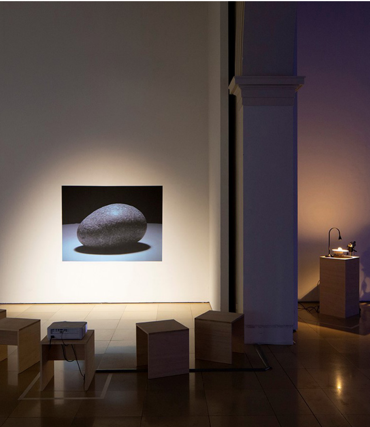
Findling (Erratic Block) #4, 2023