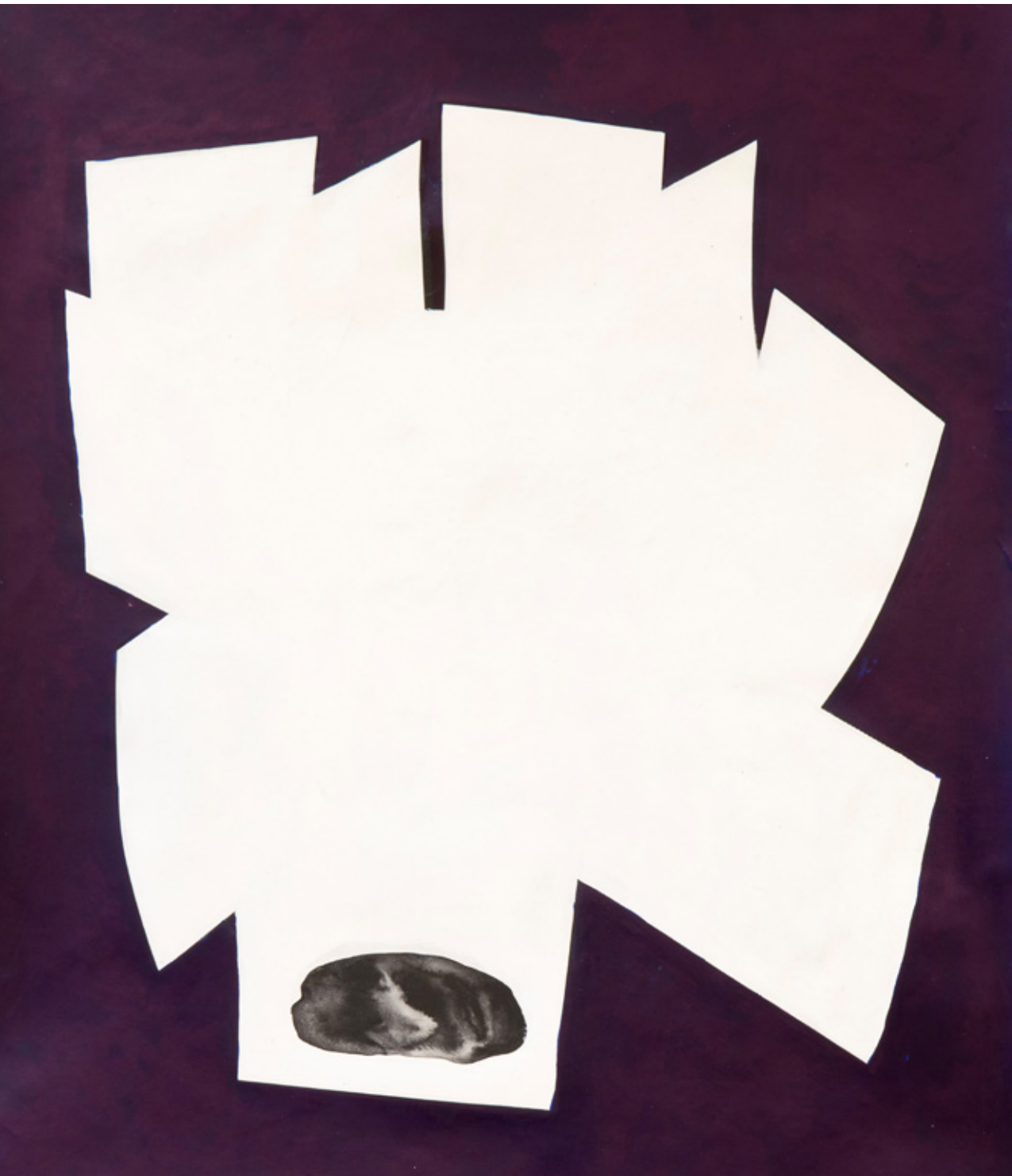
Steinwald I - To Become One, 2020