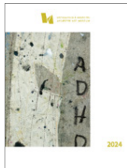
Georg Óskar ADHD 2024 (hluti úr verki / detail)

Árbók Listasafnsins á Akureyri 2024 skartar fjórum mismunandi forsíðum. Akureyri Art Museum's Program-booklet 2024 has four different covers.