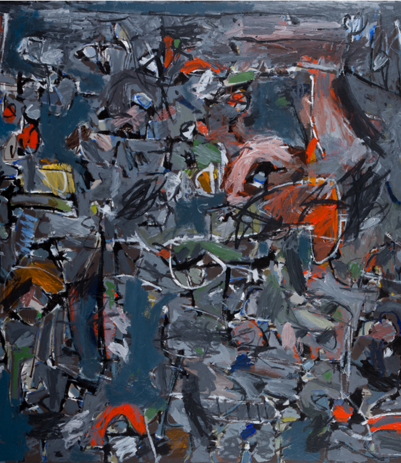
Óli G. Jóhannsson, Við bergsins blakka vegg , án ártals / undated (hluti úr verki / detail)